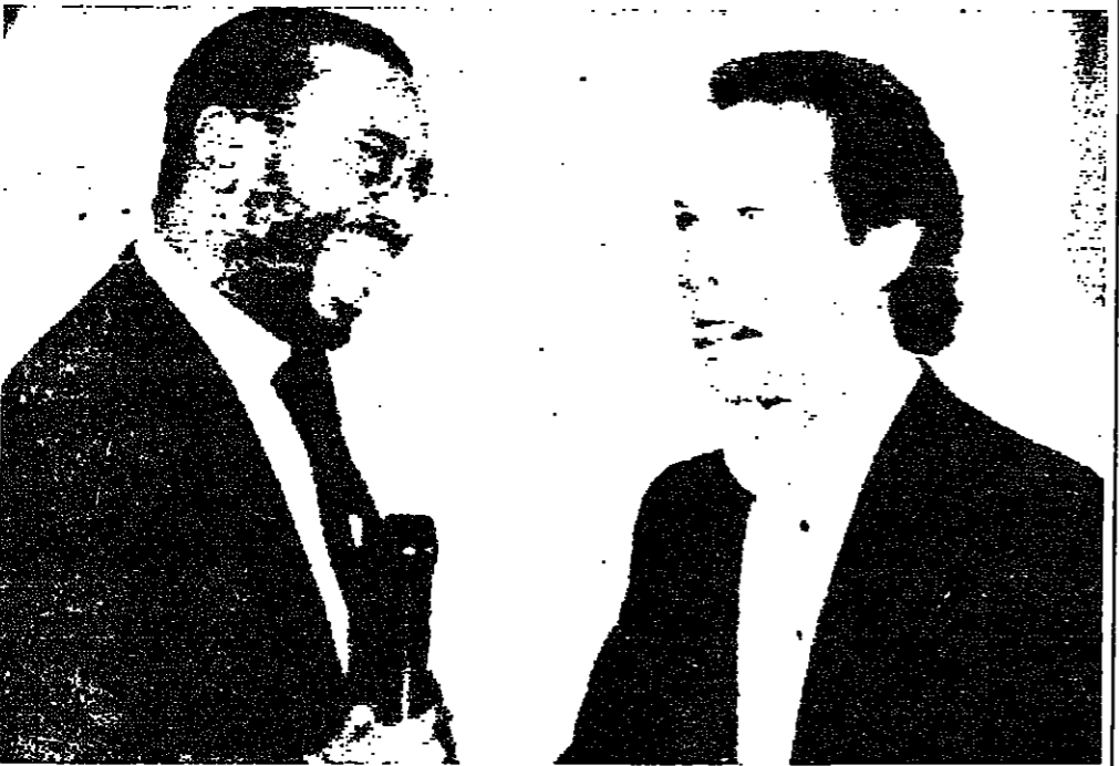
المغني ووضع الألبان بوبي ماك فيرين (إلى اليسار) في جوار هرتي مع بيللي كريستال، مقدم برنامج حفلة جوائز غرامي، قبل قيامه بتأدية أغنية خاصة. ماك